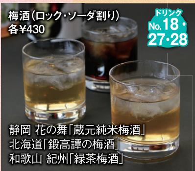
ドリンク No. 18・27・28 梅酒(ロック・ソーダ割り) 各¥430