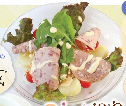
No. 12 ドイツハムと ルッコラのサラダ (チーズガーリック ドレッシング付き) ¥750 2種類のツンゲンヴルストを 相性の良いルッコラと サラダにしました