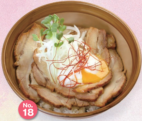
No. 18 豚バラチャーシュー温玉丼 ¥950 やわらかチャーシューを敷き詰め 甘辛のタレが食欲をそそります