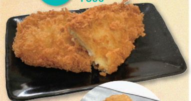
ドリンク No. 75 ササミチーズフライ ¥300