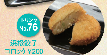
ドリンク No. 76 浜松餃子 コロッケ ¥200

お知らせ ・広島県産カキフライ(休止)→海鮮ミックスフライ(定食¥1,200・単品¥1,000)に変更・白玉おしろこ(休止)・クレープ(メープルプリン・終売・キャラメルバナナに変更)