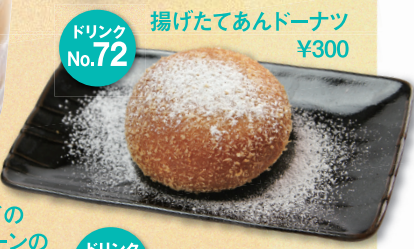
ドリンク No. 72 揚げたてあんドーナツ ¥300