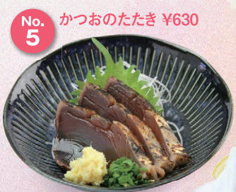
No. 5 かつおのたたき ¥630