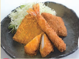
No. 31 海鮮ミックスフライ 定食 ¥1,200 単品 ¥1,000