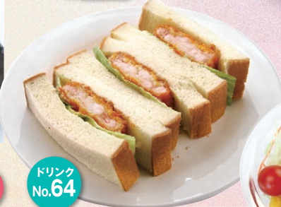
ドリンク No. 64 プリプリ海老カツサンド ¥500