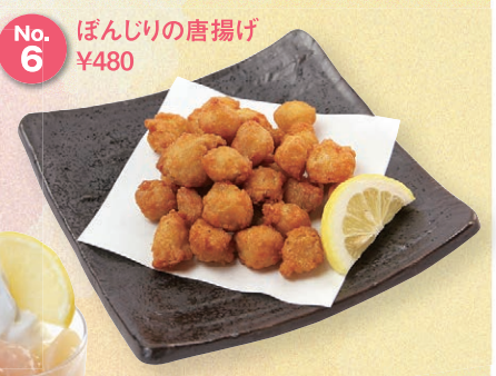
No. 6 ぼんじりの唐揚げ ¥480