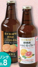
ドリンク No. 8 クラフトチューハイ 各¥600 (三ヶ日みかん/ 浜松ルビーグレープフルーツ)