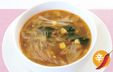
No. 20 貝だくさんピリ辛春雨スープ ¥450 中華スープにラー油で辛みを付け たっぷり野菜を入れました