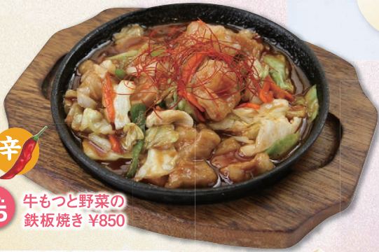
No. 25 牛もつと野菜の 鉄板焼き ¥850