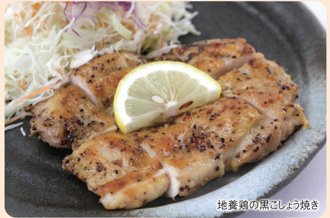
地養鶏の黒こしょう焼き