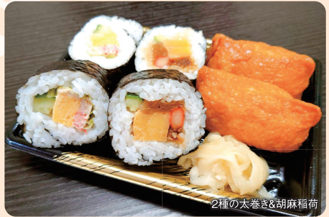
2種の太巻き&胡麻稲荷