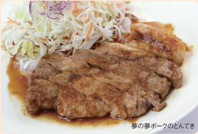
夢の夢ポークのとんてき