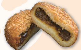
揚げたてカレーパン