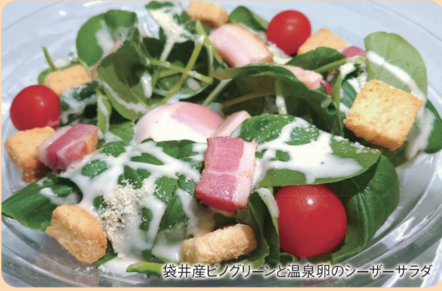
袋井産ピノグリーンと温泉卵のシーザーサラダ