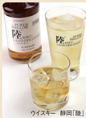
ウイスキー 静岡「陸」