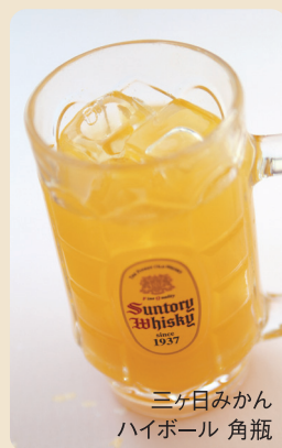
三ヶ日みかん ハイボール 角瓶