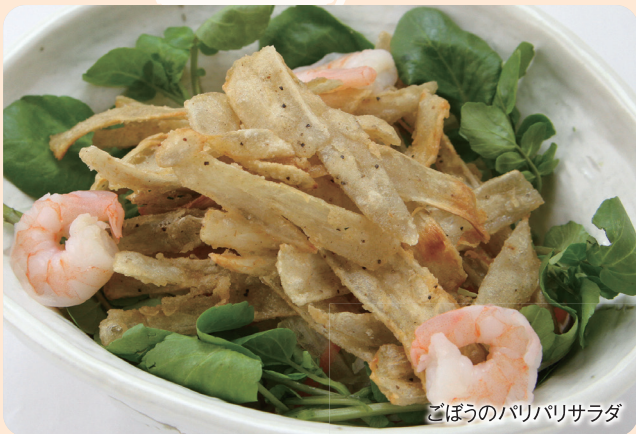
ごぼうのパリパリサラダ