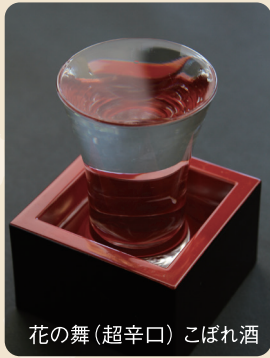
花の舞(超辛口) こぼれ酒