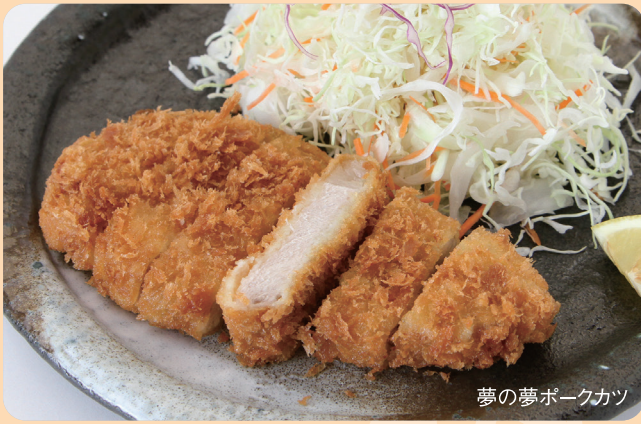
夢の夢ポークカツ