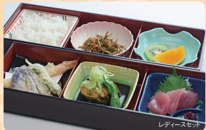
レディースセット