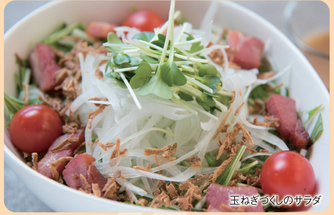
玉ねぎづくしのサラダ