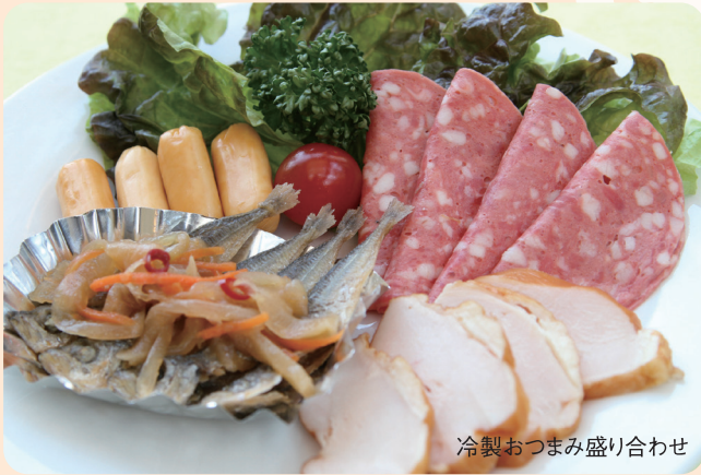
冷製おつまみ盛り合わせ