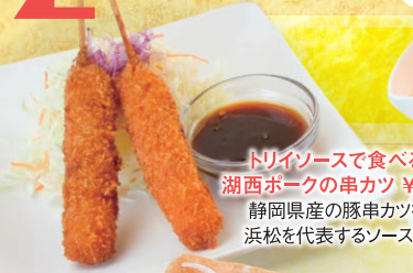
トリソースで食べる湖西ボークの串カツ ¥680 静岡県産の豚串カツを浜松を代表するソースで