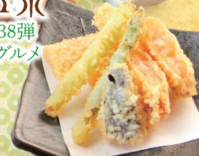
海老の湯葉巻きと旬野菜の天ぷら (抹茶塩付き) ¥730 海老の湯葉巻きと筍、アスパラを京都らしく抹茶塩でどうぞ