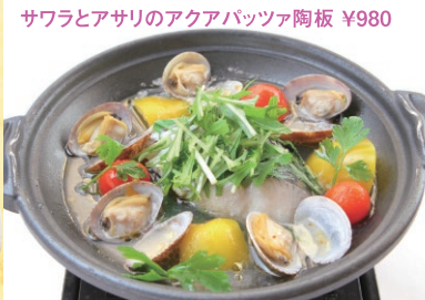
サワラとアサリのアクアパッツァ陶板 ¥980