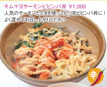
キムマヨサーモンピビンバ丼 ¥1,000 人気のサーモンたたきを使ってピリ辛ピビンバ丼によく混ぜてお召し上がりください