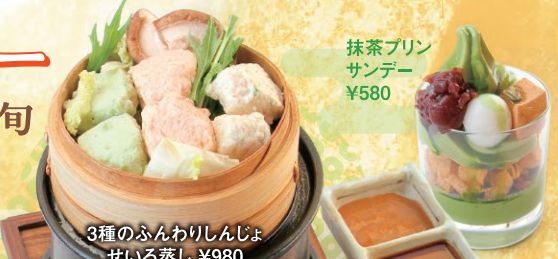
3種のふんわりしんじょ せいろ蒸し ¥980 海老・白身魚・枝豆3種のしんじょを柚子味噌、ポン酢お好みのタレでどうぞ

九条ネギ入りにしんそぼ ¥880 甘辛にしんに京都産九条ネギと旬の茎付き国産わかめをトッピングしました