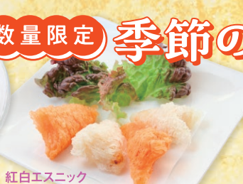
紅白エスニック 春巻き ¥680

九条ネギ入りにしんそぼ ¥880 甘辛にしんに京都産九条ネギと旬の茎付き国産わかめをトッピングしました