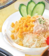
ツナとコーンのサラダ ¥350