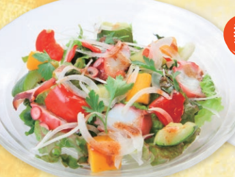
蒸しタコとグリル野菜のサラダ (バルサミコオリブドレッシング付き) ¥780