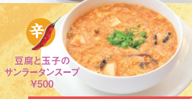
辛 豆腐と玉子のサンラータンスープ ¥500