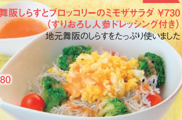
舞阪しらすとブロッコリーのミモザサラダ ¥730 (すりおろし人参ドレッシング付き) 地元舞阪のしらすをたっぷり使いました